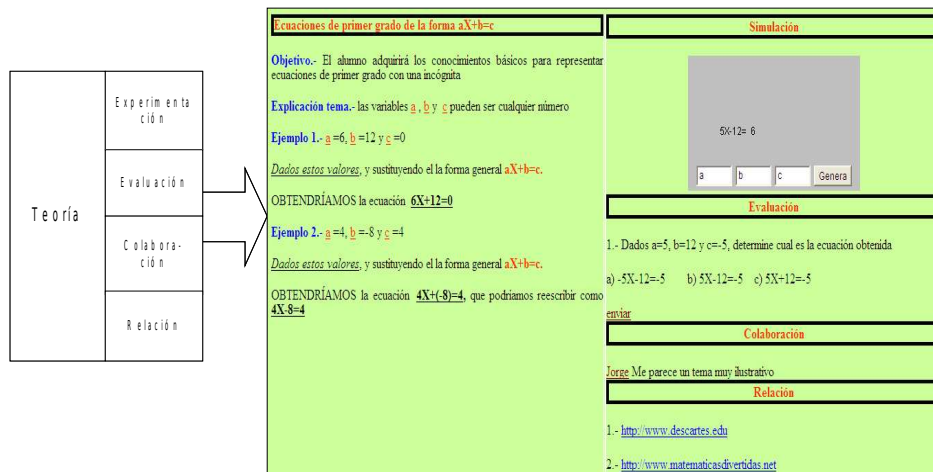
Fig. 3.- Creación de un OA con los elementos propuestos.